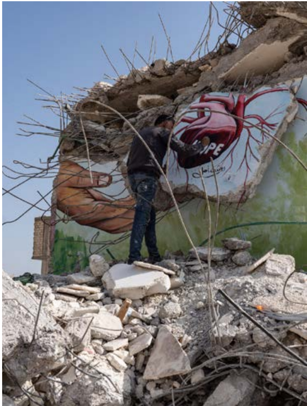
Bandorên wêranker ên erdhejê ne tenê li Tirkiyeyê, li Sûriyeyê jî bi giranî hatin hîskirin.

Çêkirina bîrdariyê jî armanc dike ku bandorên psîkolojîk, hestiyarî û çandî yên bûyerên biêş, bi qebûlkirina êşên mexdûran, parastina bîranîna tiştên qewimîne û pêkanîna feraseteke hevpar a têkildarî demên borî derxe holê û bi vî rengî tevkarîyê li lihevkerina civakî bike 6 .