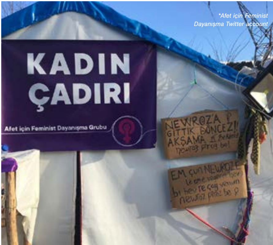
*Afet için Feminist Dayanışma Twitter account

ji karesatê rizgar bûne hildin, bi referansa vê sîstemê hatiye dayîn. Ji ber hilweşîna binesaziyê ya piştî karesatê û pirsgrîkên xwegihandina înternetê, zehmetiya serlêdana her malbatekê bi sîstema e-Devletê re jî di nava astengiyên burokratik de bû 8 . Her wiha gelek kesên ku ji erdhejê sax xelas bûne, nekarîn xwe bigihînin cenazeyên xizmên xwe û Saziya Tiba Edlî û Wezareta Dadê têkildarî kesên di erdhejê de winda bûne bi aşkerayî tev negerî û rê li ber daneyên têkildarî windahiyan venekirin û ev jî bû sedem ku mafê weşartina miriyan û şingirtinê bê binpêkirin 9 .